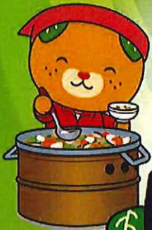
愛媛県イメージアップキャラクター みぎやん